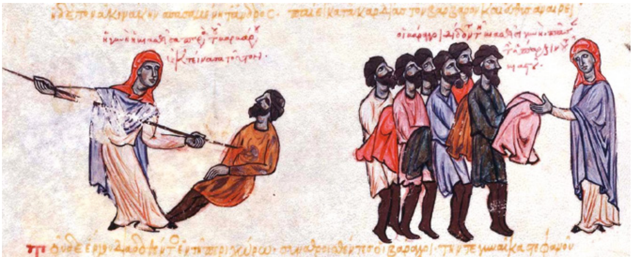
Тракијска жена убива Варјак, кој се обидел да ја силува. Неговите другари ја пофалуваат и ѝ ги даваат предметите што ги поседувал убиениот

држава, бидејќи полскиот прв владател Мјешко е Викинг - паганин. Дракарите ги префрлувале од една река во друга, преку суво, влечејќи ги сами или со помош на месното население (сигурно под принуда).