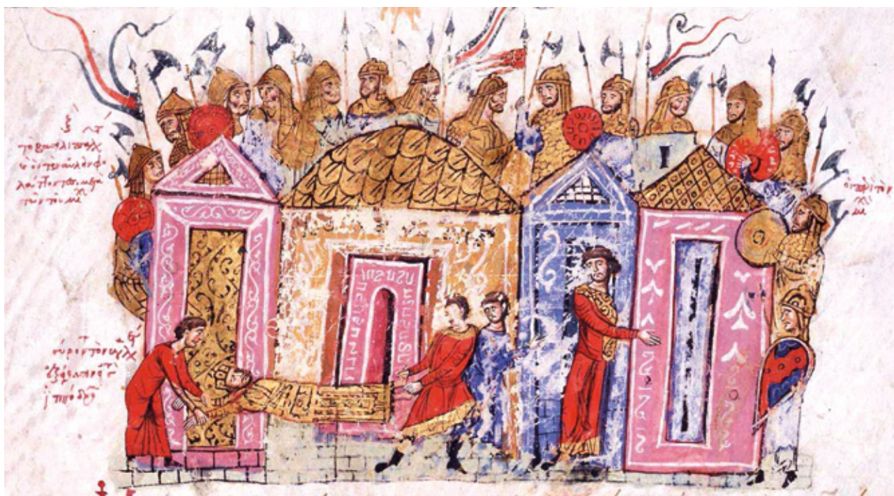
Варијашката гарда во Константинопол, илустрација во книгата на Јован Скилица

Во 1989 г. престојував во Шведска, еден месец, јули, вистинско лето. Тамошните колеги од мојата бранша ми укажаа на над 10 камени стени, споменици со викиншки руни, на кои пишува дека во 10. и 11 век нордијци се бореле во источниот Медитеран, од страната на ромејскиот цар. Да бидам попрецизен, се мисли на Византија, но тој термин не се користел во времето кога постоела државата. Внесен е во 18 век од францускиот историчар Монтескје. До крајот на царството - 1453 г. вторник, 29 мај, народот се нарекувал Ромеи - Римјани, зборот е старогрчки и значи „силни“. Во Источното Римско Царство, вториот Рим, во 6 век престанале да го користат лагинскиот и го прифатиле грчкиот јазик (оттука е името на династијата Палеолог - старозборување).