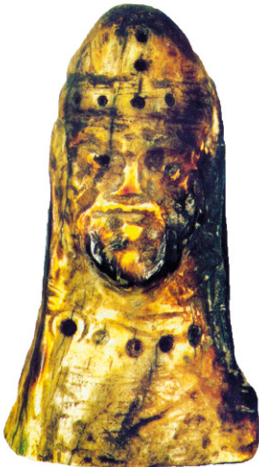
Шаховиска фигура со лик на војник најдена при ископување на скопското Кале, сведоштво за присуство на Викинзите на овие простори

пристигнувале до Каспиското Море. Во Шведска постои еден врежан рунски натпис на камена стена - споменик, посветена на Ингман патникот (од ова викиншко име изведено е руското Игор) кој му служел на кнезот Ярослав, а вели дека Ингман стигнал до Грузија. Грузијците Грузија во нивниот јазик ја викаат Сакатвело, а Викинзите Саркланд. Со оваа констатација се побива западното тврдење дека Саркланд ја викале заради Сарацените. Фактички зборот е идентичен со името што го има во автентичниот говор.