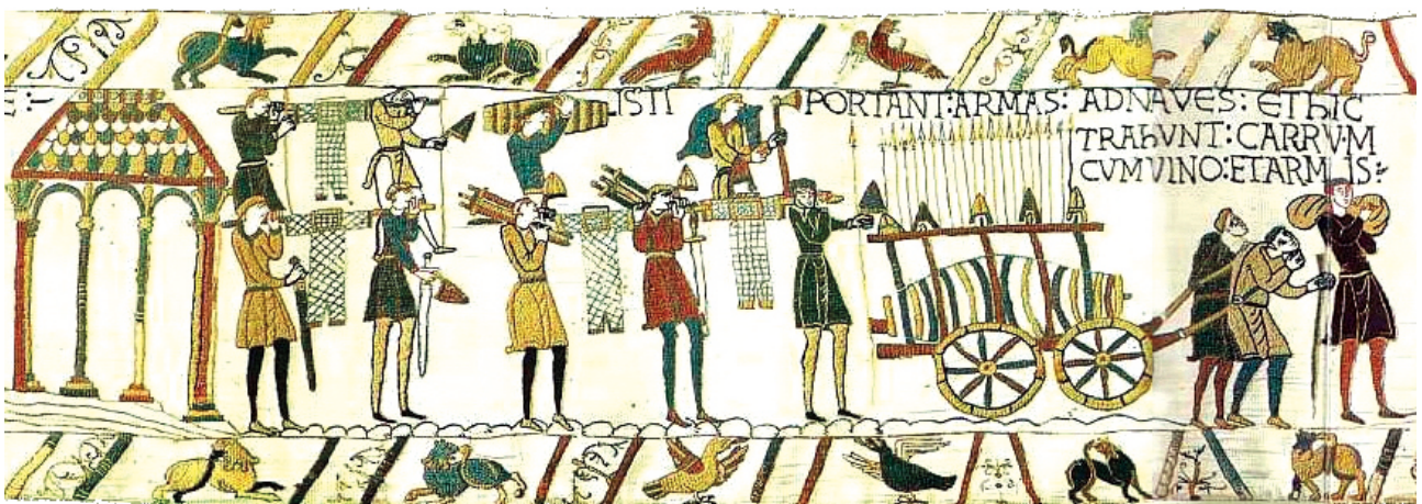
Детал од таписеријата од Баје, Франција

Од Киев до Херсон пловеле по Дњепар, а оттаму по Црно Море, па по реките Дон и Волга